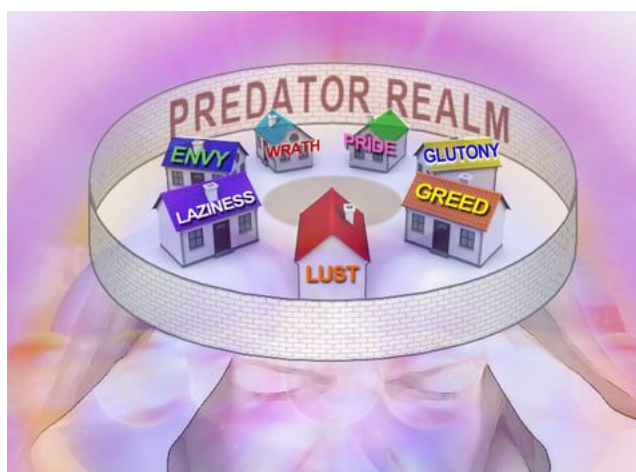
Mauern der Trennung + Häuser des Egos = Reich des Raubtiers/Räubers